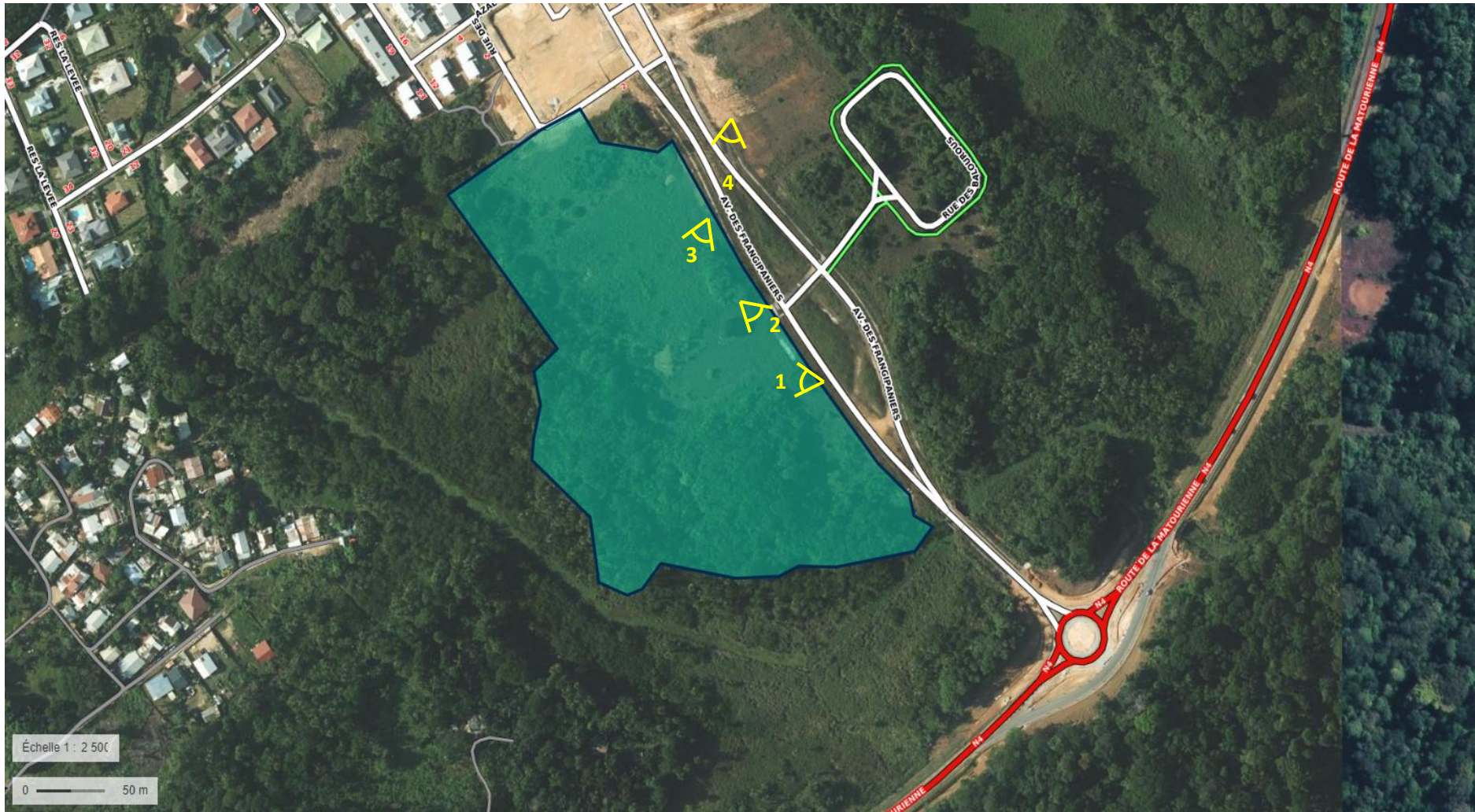
Annexe 4 – Localisation des photographies